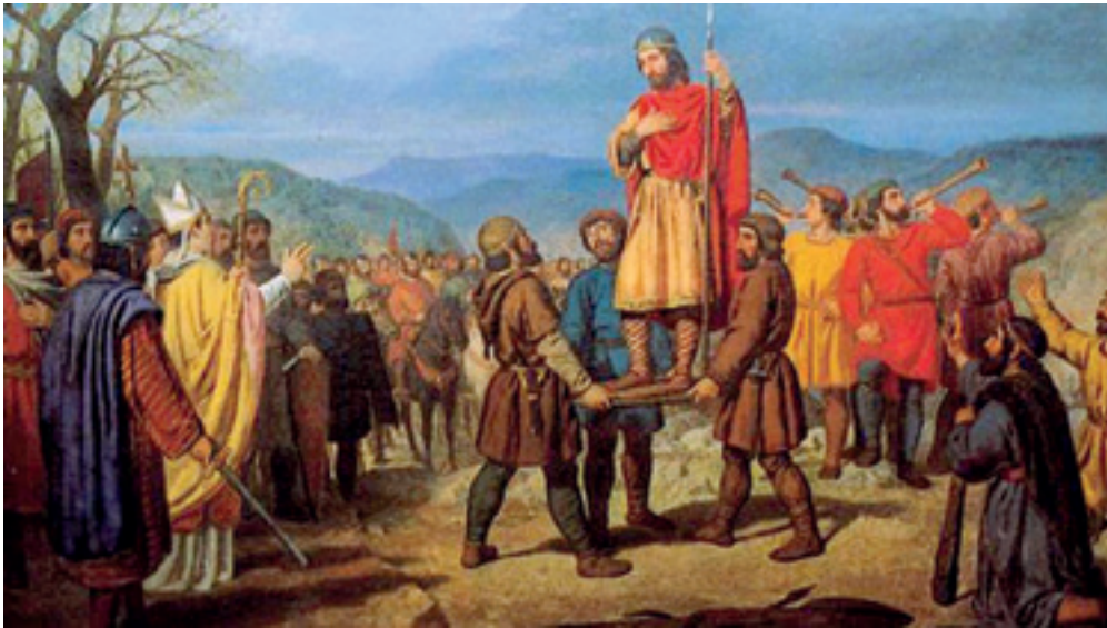
Nafarroako Jauregian dagoen margolana, errege nafarraren tronuratzea irudikatzen duena.

Urriaren 26an izango da emanaldia Santa Anan (19:00)