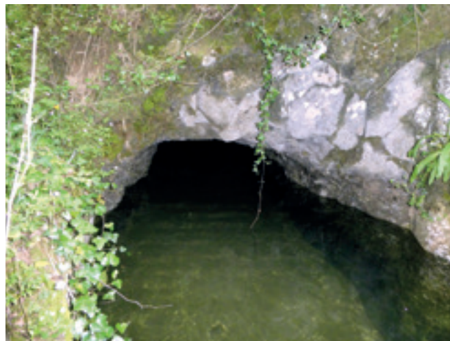
Ezkerrian, Saratxoko bokia Araotz aldetik, itxitta. Eskuman, Saratxoko ubidiaren bokia Urrusula aldetik . R. ALTUNA

"Nere mutiko denporan, argixa Ubaotik bota bihar euela zabaldu zan. Ubaotik xaguan linea bat Olatera, eta illunkaran, seietan-edo, ordua ifnitta, eta jentia ikustera fan ei zuan, argixa gorrixa etorriko zalakuan ikustera fanda... Aspertu ziranian, fan zittuan etxera, eta etxian argixa!"