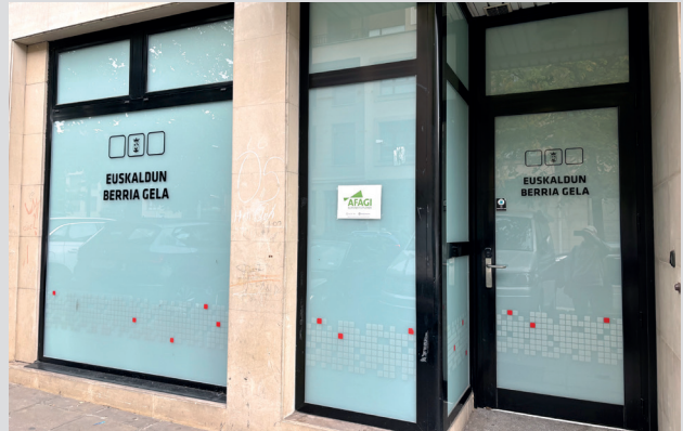
Bidebarrieta kaleko 18an eskaintzen ditu bere zerbitzuak AFAGI elkarteak, astearte eta ostegun goizetan

Horrez gain, informazio zerbitzua ere eskaintzen du AFAGIk bulego honetan bertan, aurrez hitzordua eskatuta: 943 297 118 / afagi@afagi.eus . AFAGIk laguntza psiko-sozial pertsonalizatua eta aholkularitza eskaintzen dio Alzheimerre duen pertsonaren familiari.