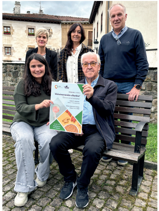
Udaleko eta AFAGIko ordezkariak

Estimulazio kognitiborako tailerra eskainiko du AFAGIk Oñatin, eta baita informazio bulegoa ere, alzheimerra edo beste dementziaren bat duten pertsoneri eta senideei informazioa eta laguntza eskaintzeko